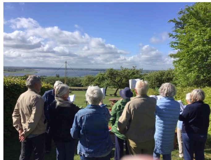
fra morgensang på Munkebo Bakke